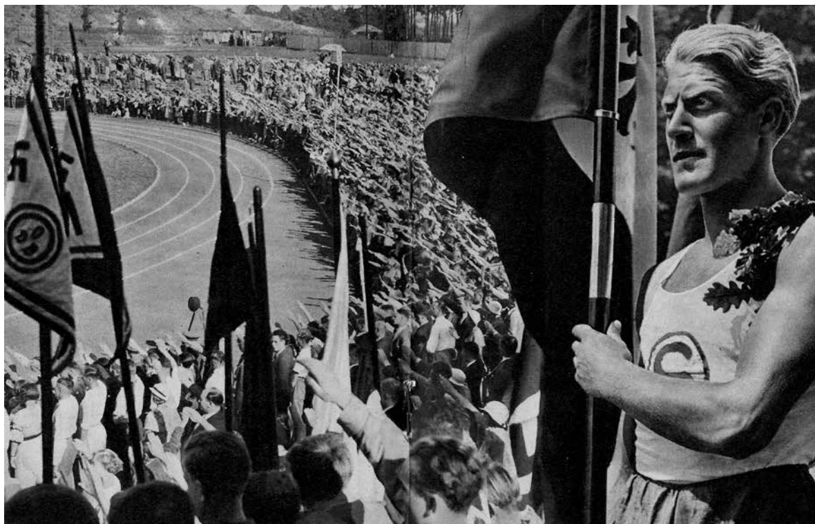
Laufen und Gehen. Olympia-Book , n. 8, em associação com o Reichssportführer publicado pela propaganda Rusfchub, Berlim: Sports Advertising Office, 1936, p. 16-17.

Aos olhos de Aracy, ampliava-se o círculo dos judeus escorraçados que, desde o boicote econômico ao comércio implementado em 1933, mostravam-se perplexos, aterrorizados. As condições de sobrevivência estavam minguando, em contraposição à intolerância que assumia dimensões inexplicáveis. As ações antissemitas repercutiram, de imediato, nos consulados que, a partir de então, passaram a receber milhares de pedidos de vistos de judeus que queriam emigrar da Alemanha para a Holanda, a França, os Estados Unidos, a Palestina e os países da América do Sul, incluindo Brasil, Argentina, Chile e Bolívia. Entre 1933 e 1935, cerca de 78 mil judeus saíram da Alemanha, e, em 1938, a emigração atingiu um total de 150 mil, ou seja, uma parcela considerável da população judaica da Alemanha.