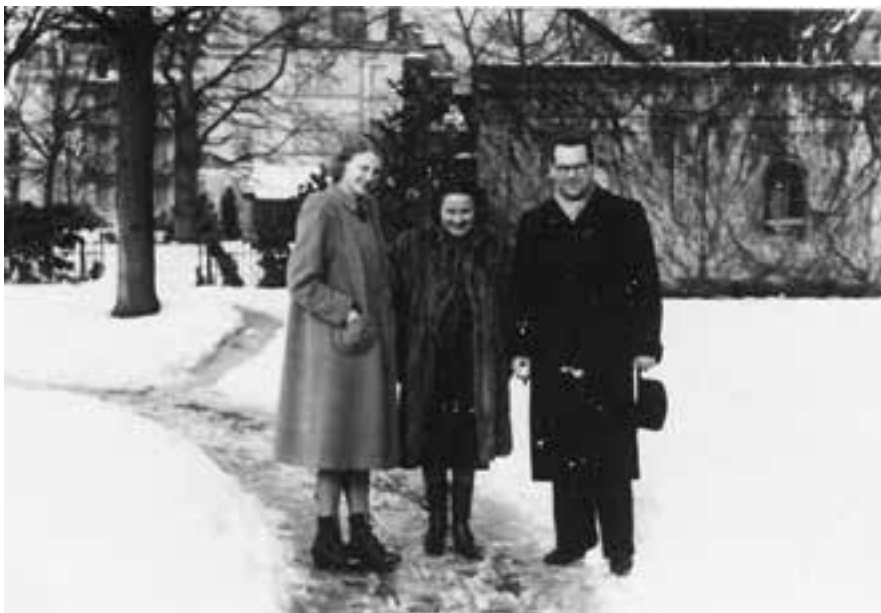
Aracy e Guimarães Rosa em Baden-Baden, 1941.

Diante da deterioração da conjuntura internacional, a embaixada brasileira em Berlim instruiu Guimarães Rosa, cônsul adjunto, a se desfazer dos documentos do consulado de Hamburgo, incluindo pedidos e registros de vistos e passaportes em branco. De dezembro de 1941 a 26 de janeiro de 1942, Guimarães Rosa e Aracy cuidaram de incinerar e listar os documentos incinerados, atendendo às instruções superiores (Listas de documentos incinerados, dez. 1941 – AHI/Rj).