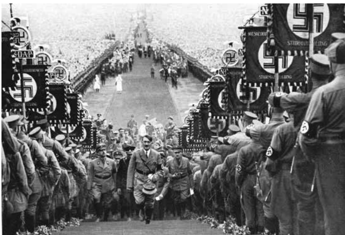
Ascensão de Hitler. Bückeberg, 1934.