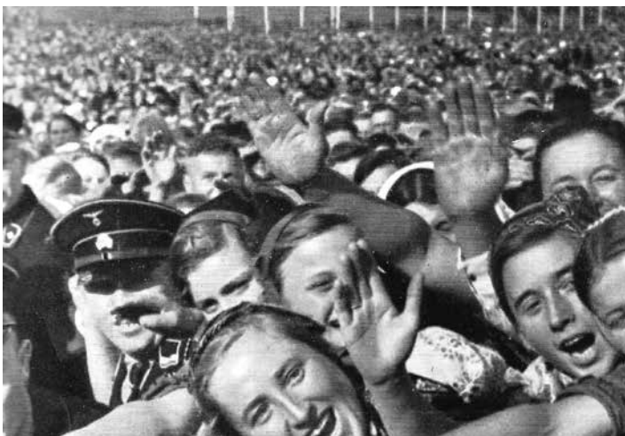
Jovens saúdam o líder Adolf Hitler. Bückeberg, 1935.

Fotografias de Heinrich Hoffmann. Álbum Adolf Hitler. Bilder aus dem Leben des Führers . Leipzig: Cigaretten-Bilderdienst, Altona-Bahrenfeld, 1936. p. 89, 128, 63. Acervo: Tucci/SP.