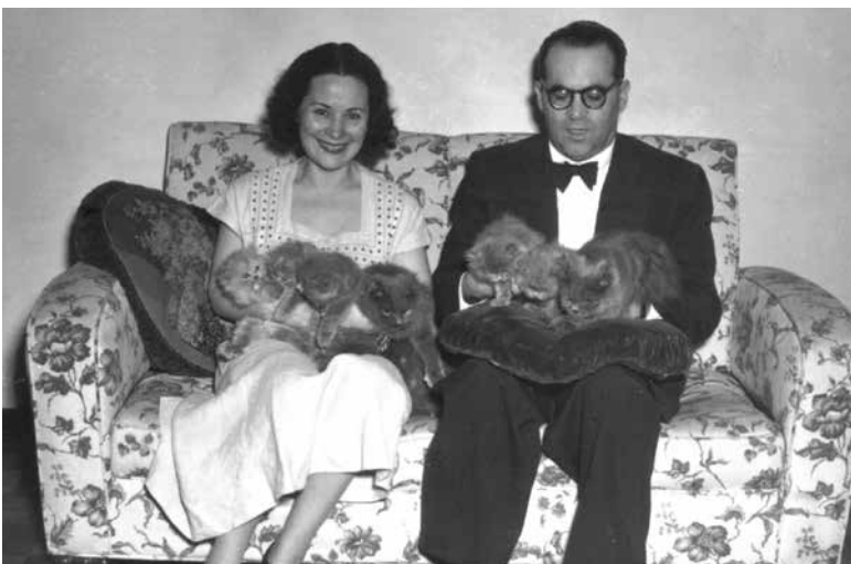
Aracy e Guimarães Rosa com seus gatinhos. Rio de Janeiro, 1957.

Serás tudo para mim: mulher, amante, amiga e companheira. Sim, querida, hás de ajudar-me a escrever os nossos livros. Não só passarás à máquina que eu escrever, como poderás auxiliar-me muito. Tu mesma não sabes o que vales. Eu sei, e sempre disse, que tens extraordinário gosto, para julgar coisas escritas. Muito bom gosto e bom senso crítico. Serás, além de inspiradora, uma colaboradora valiosa, apesar ou talvez mesmo por não teres pretensões de “literata pedante”. E estaremos sempre juntos, leremos juntos, passearemos juntos, nos divertiremos juntos, envelheceremos juntos, morreremos juntos. B