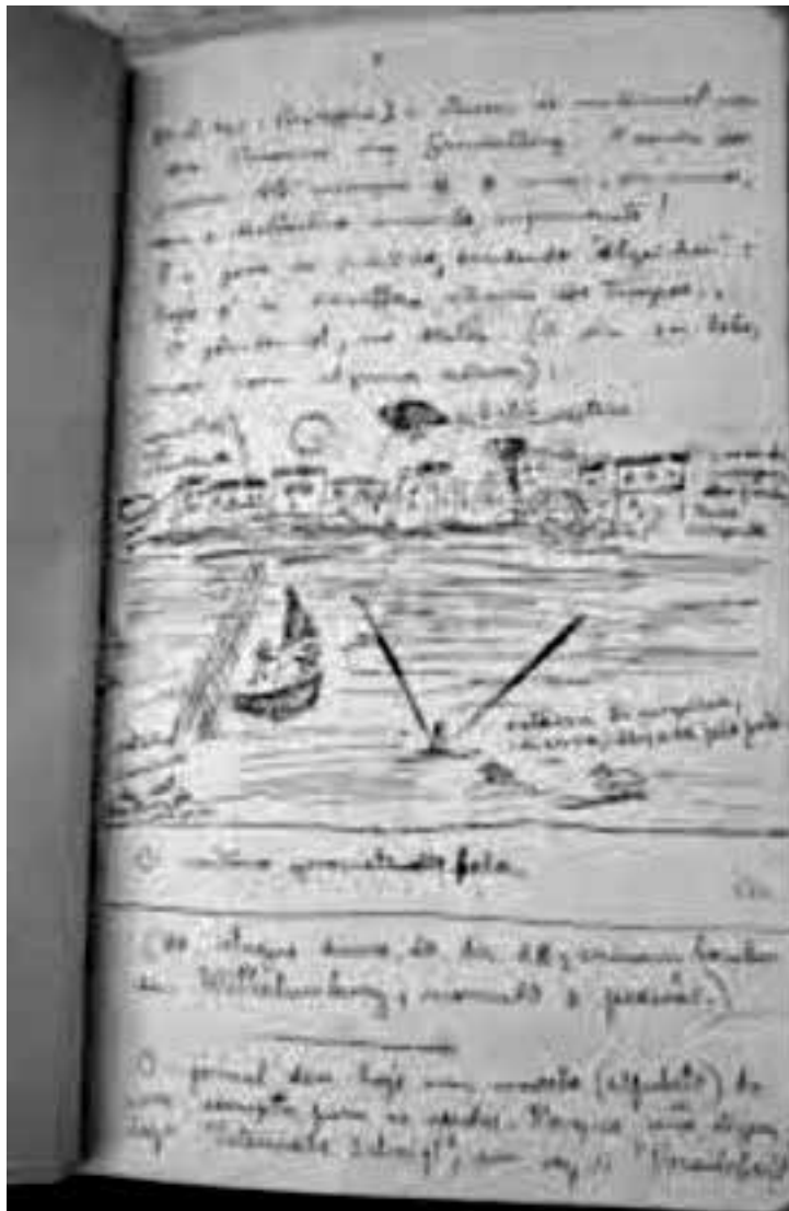
Página do diário de Guimarães Rosa produzido durante o período em que o diplomata viveu em Hamburgo.

Na documentação do Arquivo Histórico do Itamaraty no Rio de Janeiro, não há indícios do envolvimento direto de Guimarães Rosa com as ações salvacionistas de Aracy, mas, certamente, os devidos cuidados foram tomados pelo casal, tendo em vista as restrições impostas pelo Itamaraty. Aracy, além dos vistos, conseguia forjar também passaportes sem o “J” vermelho que assinalava para as autoridades consulares e nazistas a identidade judaica