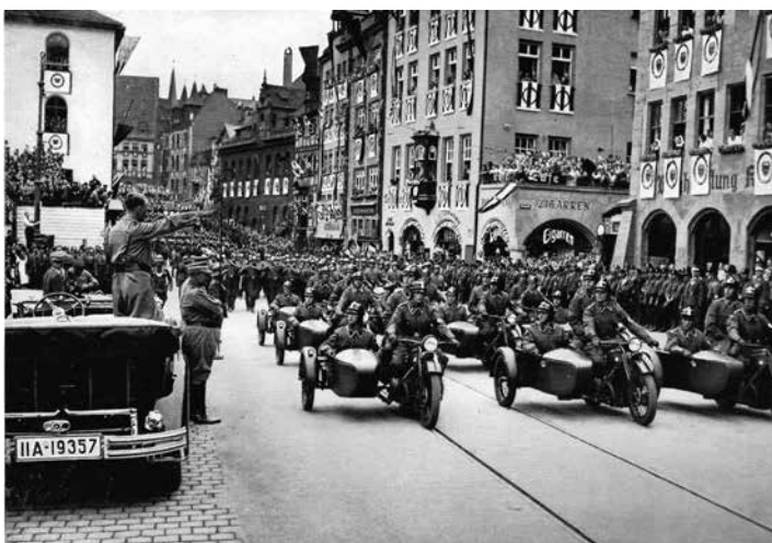
Desfile da SS diante do líder na Reichsparteitag , 1935.