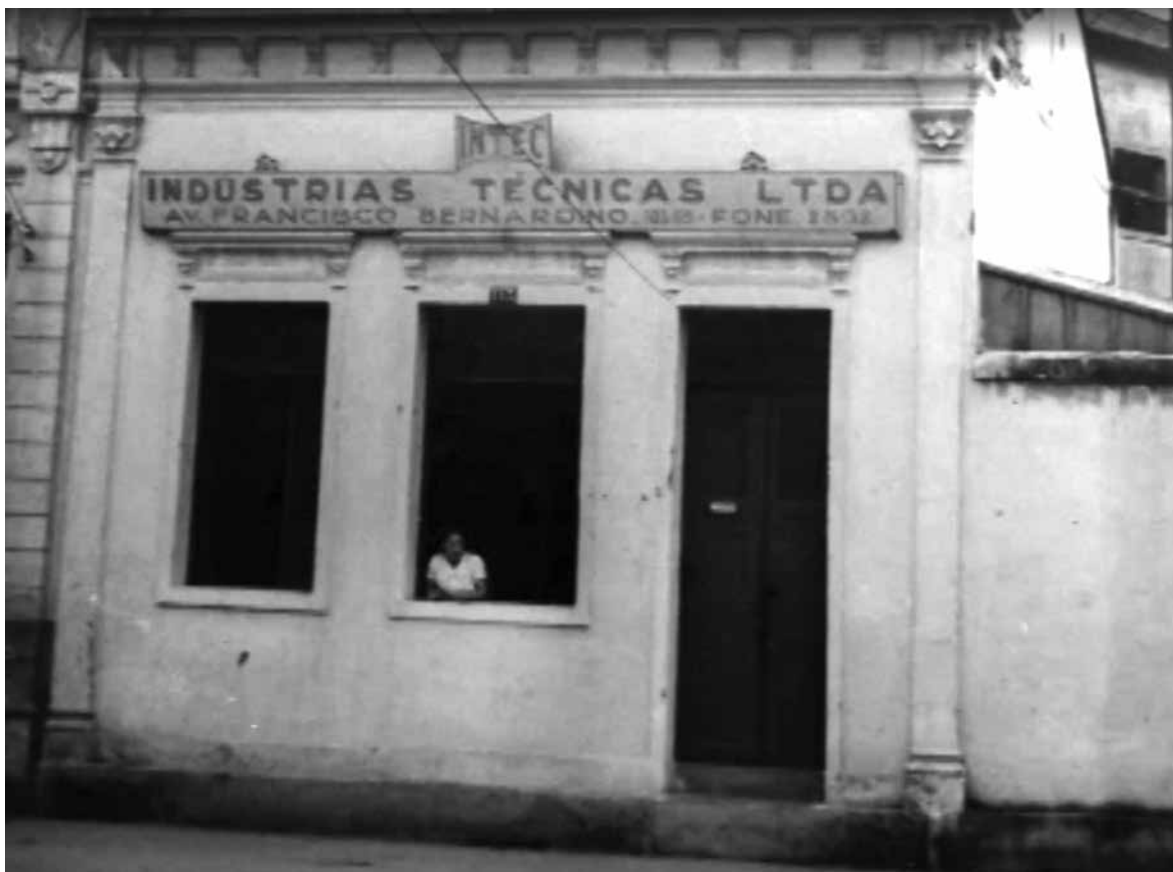
Fachada da casinha que abrigava a Intec, na Avenida Francisco Bernardino, em Juiz de Fora, s.d.