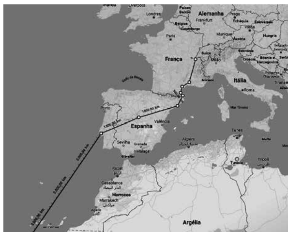
De Genebra (Suíça) a Juiz de Fora, MG (Brasil).

Comunidade de destino: Juiz de Fora (MG).