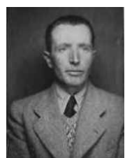
Erwin Wind Fotógrafo