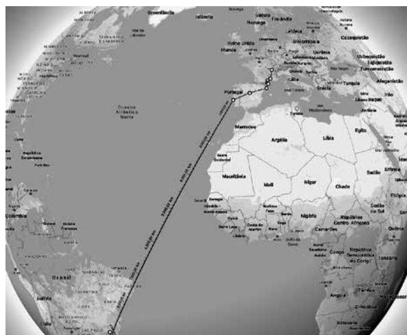
De Genebra (Suíça) a Juiz de Fora, MG (Brasil). Detalhe do Google Maps.