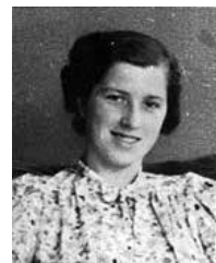
Walter Altmann Empres. do Comércio