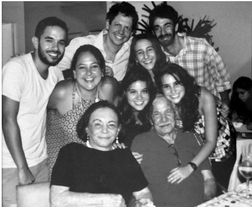
Família Freihof, c. 2015, Rio de Janeiro. Acervo: Freihof/RJ; Arqshoah-Leer/USP.

Não sou filósofo, mas, às vezes, eu pergunto: o mundo não é um teatro? Gosto e mastigo aquilo que eu sinto! Dou-me o direito de dizer que conheço a geografia do mundo, viajei por todos esses países, fui até a China onde comi num restaurante primitivo, pois não gosto de luxo. O luxo é falso! Entendo que restaurante tem que ser para comer. Cada país tem a sua própria mentalidade, a mulher de Copacabana é diferente daquela que mora no Leblon. Eu gosto de ver o mundo de hoje. Morei em Ipanema num apartamento muito grande até o dia em que pensei assim: “Estou cansado...!”. Mas não era um cansaço físico. Entendo que o tempo cura, como diz aquela frase em hebraico: “O que o tempo te ensina, a cabeça não imagina isso”. Isso conta, aprendi palavras boas quando era criança, gosto da minha religião. Sou engraçado, sou realista. Deixo aqui a minha mensagem: você ser digno com o seu próximo; não importa quem ele é, não importa!