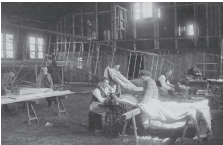
Prisioneiros do campo trabalhando no interior da fábrica de aviões Heinkel Flugzeugwerk, sob o controle dos nazistas a partir de 1942. Budzyń, s. d.

Lá na fábrica, nossa alimentação era “normal”, comida de operário de fábrica. Não ganhávamos dinheiro, não! Comida! E graças ao nosso campo foi construída a fábrica que, para chegarmos até ela, tínhamos que atravessar uns dois a três quilômetros todos os dias. Assim, foi feito o nosso campo de concentração em Budzyń, onde era a fábrica, e que somente funcionou quando levaram pessoas de outras cidades, de outros lugares. Logo no início nada funcionou, enferrujou. A