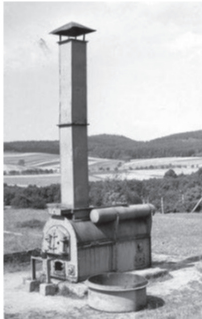
Crematório do campo de concentração de Groß-Rosen.

Eu passei por muitos campos...! As transferências aconteciam de uma ocupação para a outra; e as transferências não significavam nada porque sabíamos que só podíamos piorar. Não ia melhorar, não é mesmo? Eu tinha noção das coisas, pois essa era uma política feita para exterminar os prisioneiros. No campo de Budzyń só havia um banheiro, uma latrina, com uma madeira de 20 centímetros, sem lugar para sentar: era um pedaço de pau onde eu sentava e escutava as histórias que eram contadas do lado de fora. E lá havia gente muito inteligente, muitos sábios, muitos bons médicos, tudo de bom. E lá, nesse “banheiro”, eu fazia de conta que ia fazer xixi e cocô toda hora, mas era mesmo para escutar. Eu ficava lá sentado e ninguém mexia comigo. Assim, eu sabia o que ia acontecer, como iria acontecer... Sabia de tudo, porque eles recebiam comunicação com algum aparelho. Eram sábios, por exemplo: eu tenho um sinal aqui na palma da mão direita! Foi um corte que um médico austríaco costurou,